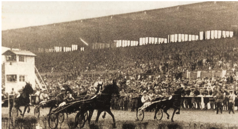
Karlshorst i forna Östberlin – 20 år efter efter Andra världskriget men minst sagt välfyllda läkare. Mycket var en mans förtjänst.

en östtyska nationalsången var vacker, men ond.