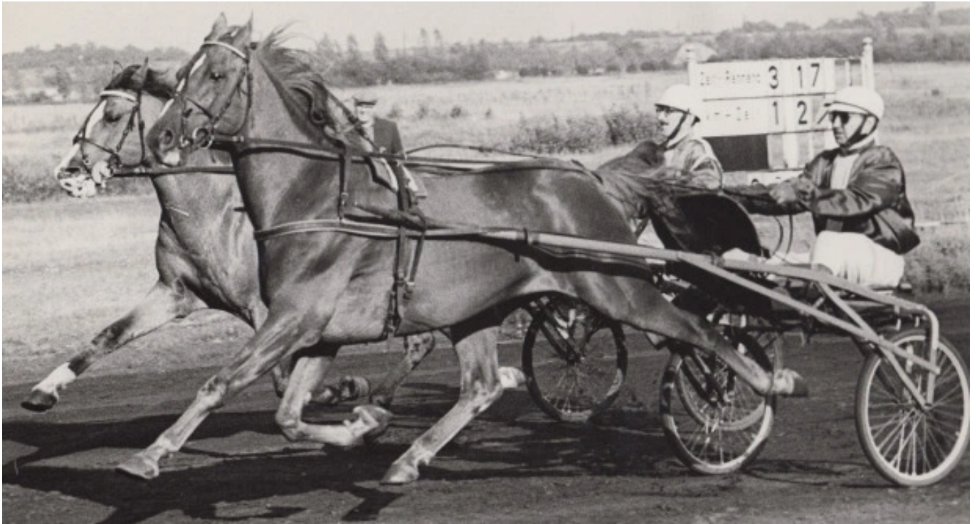
DDR:s främste avelshingst: Stentor.

DDR:s ledande förärvare var Stentor (född 1957 e. Allegretto). Hans mor, Stella Maris (e. Muscletone) vann tyska Derbyt 1943 (hon blev kvar hos ägaren i öst). Cirka ett dussin av Stentors ofullständigt bokförda kullar födda mellan 1969 och 1981 tjänade över 150.000 kronor.